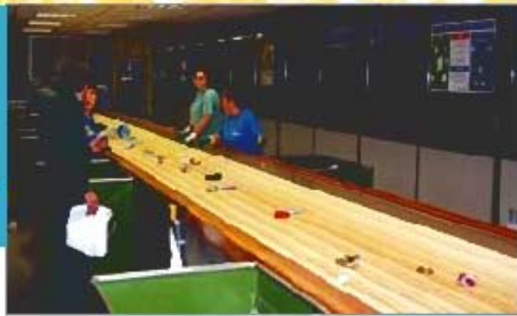
Le tapis de tri de Chinon

Nos sacs jaunes translucides contenant des emballages ménagers à recycler sont acheminés au centre de tri de Chinon ou à celui de Val Vert (Poitiers). Après ouverture manuelle des sacs, l'ensemble des déchets est envoyé sur un tapis roulant. Des personnes trient manuellement les déchets en fonction des matériaux (3 types de plastiques, cartons, acier, aluminium, briques alimentaires). Très prochainement nos emballages à recycler seront uniquement triés au centre de tri de Montlouis, actuellement en cours de construction.