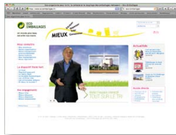
Conception : www.cawet.fr - Crédits photos : Fotolia, shutterstock